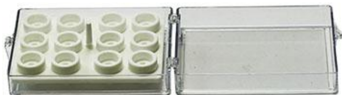
EM-Tec SC12 9.5mm φ、12.2mm φ シリシリシリシリンダースタブ 12 個用 透明スチレンボックス