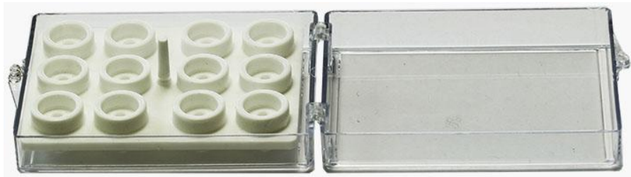
13-095012 EM-Tec SC12 透明スチレンボックス

The EM-Tec シリンダースタブストレージボックスは 9.5mm φ および 12.2mm φ のシリンダースタブに 取付けた SEM サンプルの保管用にデザインされています。彼らは小さい JEOL スタブとマウントの取扱い、長期保存、アーカイブ、および出荷 SEM サンプル用に使用することができます。試料の取扱い、長期保存、保管や移動のためにシリンダースタブを収納することができます。4 個と 12 個のスタブ用が用意されています。