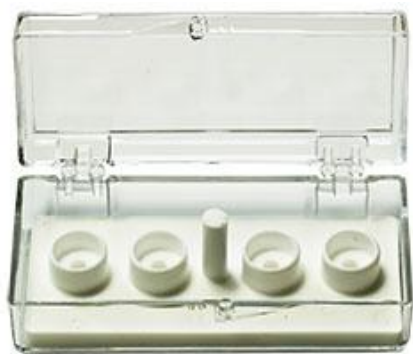
EM-Tec SJ4 9.5mm φ シリンダースタブ 4 個用 透明スチレンボックス