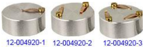
EM-Tec S-Clip 試料ホルダー 25mmφ M4