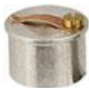
EM-Tec S-Clip 試料ホルダー 15mmEM- Tec S-Clip M4