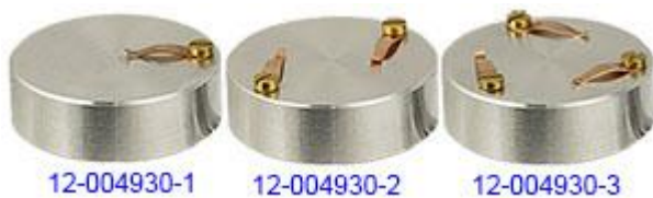
EM-Tec S-Clip 試料ホルダー 32mmφ M4