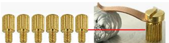
S-Clip 高さ調整ピラー, 4mm(h) 真鍮 M2x3mm オスメスネジ切