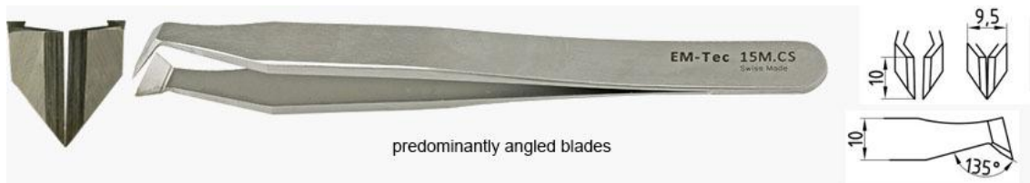
predominantly angled blades