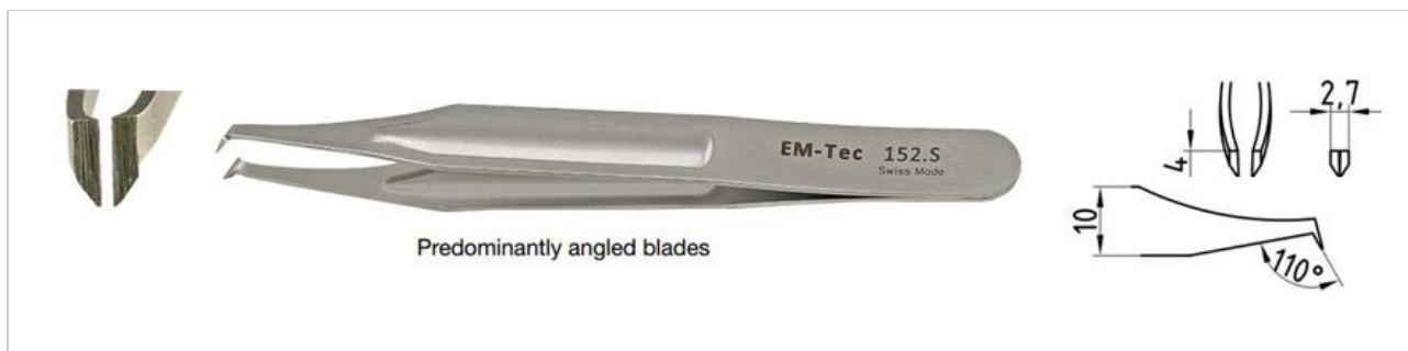
EM-Tec 152.S 高精度カッティングミニピンセット 4mm 角度付、炭素鋼